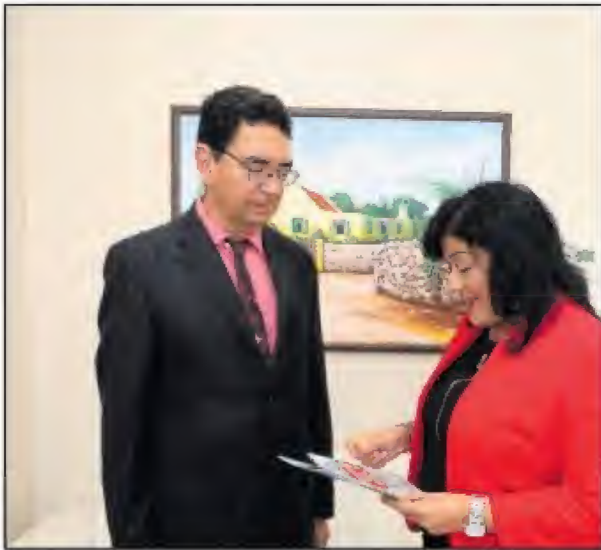
- Diamars atardi Minister di Cultura Xiomara Maduro a haci entrega di un USB na Minister di Enseñansa Sr. Rudy Lampe,

'Di un dia pa otro tur cos ta diferente' y 'Shon Wantomba y e celebracion di Dia di San Juan'